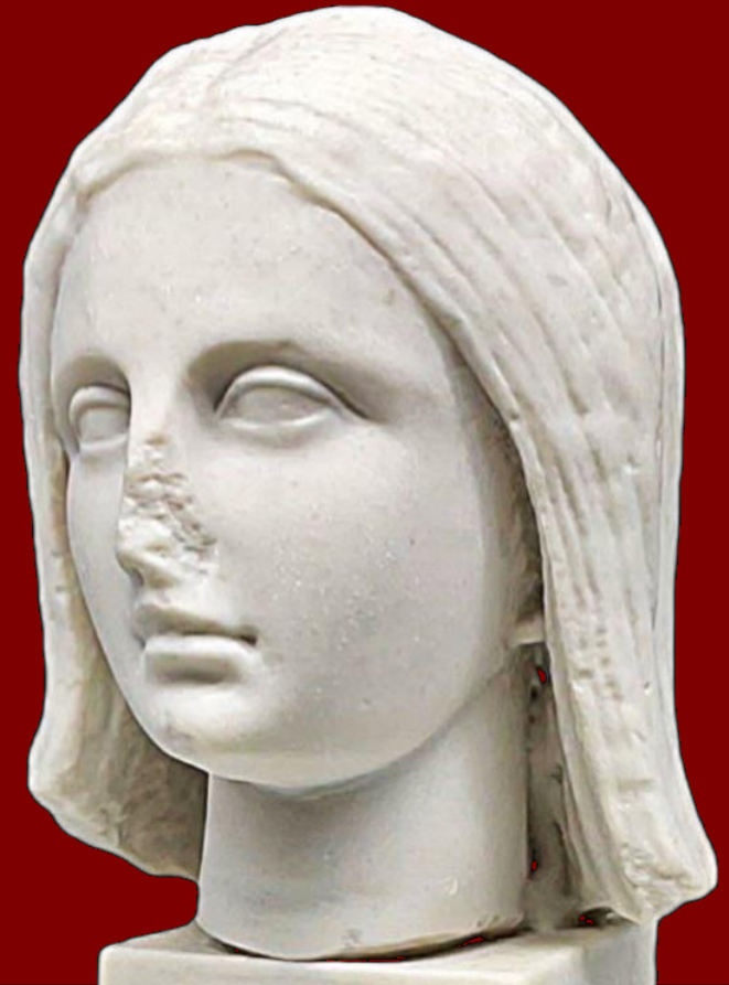
Alegoría de Hispania, siglo II (Museo Arqueológico de Sevilla)